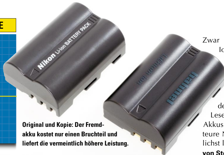
Original und Kopie: Der Fremdakkus kostet nur einen Bruchteil und liefert die vermeintlich höhere Leistung.

Zwar sind moderne Lithium-Ionen-Akkus pflegeleichter als solche mit älteren Techniken, doch schadet fehlerhafter Umgang auch bei diesen Akkus der Laufzeit und der Lebensdauer.